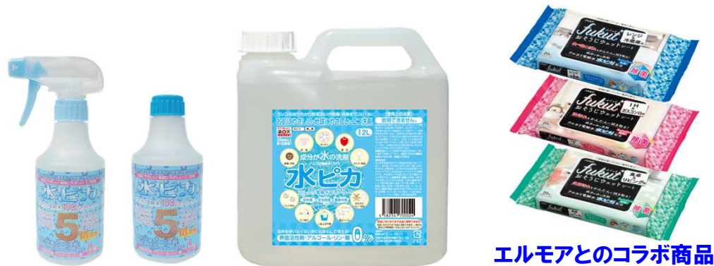
エルモアとのコラボ商品